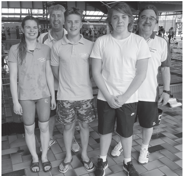
Drei der Fünf Nachwuchsschwimmer mit ihren Betreuern