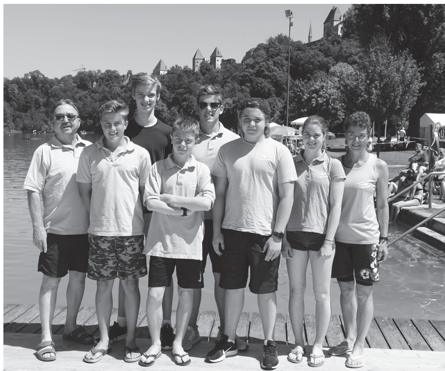
Das Lindauer Team bei den Deutschen Freiwassermeisterschaften